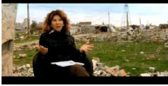
Fotoğraf 6-7: Uzmanın mekânın temsili ile doğrudan bu kentsel dönüşümü yaşayanların gündelik pratiklerini kapsayan temsili mekânlar

gibi. Uzmanlarının arka planında yer alan mekânların temsili, tanıkların gündelik pratiklerini kapsayan temsili mekânlara dönüşür (Fotoğraf 6-7).