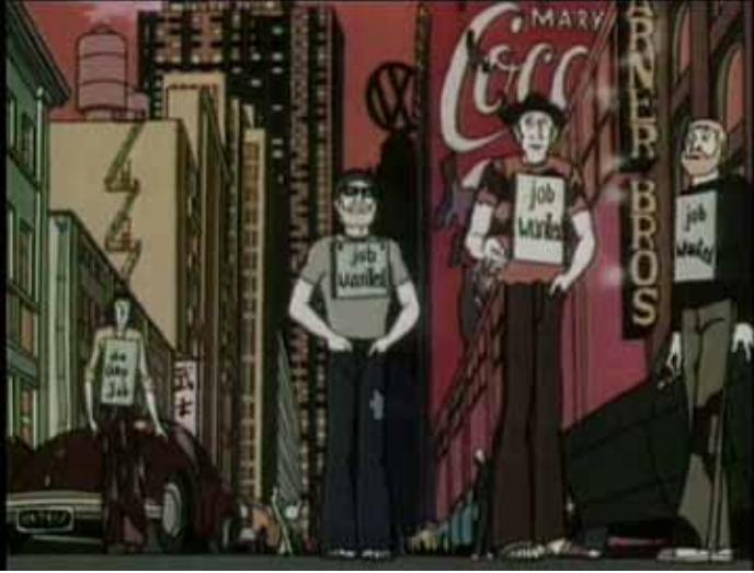
Resim 3: Atış Poligonu (1979)

Atış Poligonu 'nun (bkz. Resim 3) Amerikalı kahramanı işsizlik ve onun yol açtığı fakirlikten dolayı bir atış poligonunda kurşunlardan kaçan canlı bir hedef olmayı göze alır. İşli olanların da durumu pek parlak değildir. Temizlikçi kız gece gündüz çalışmaktan dolayı bitkin bir haldedir. Âşık olan bu iki gencin aşklarını yaşayabilecekleri insanca bir ortam yoktur. Atış poligonunda beraber çalışmaya başlayan çift, korkunçluğuna karşın duruma alışır. Animasyonun sonunda bebek bekleyen çift daha fazla katlanamayıp işi bırakır bırakmaz, işletmeci çabucak atış poligonunda çalışacak başka bir işsiz çift bulur.