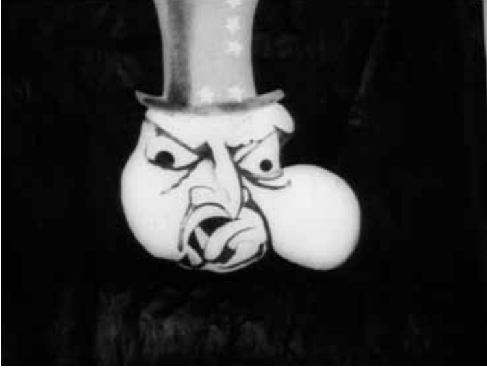
Resim 1: Gezegenlerarası Devrim (1924)

çekimlerle gösterilen kapitalist ve emperyalist, vücudunun genel hatları dışında insani özellikler taşımaz. Batılı deforme olmuş uzuvlara sahip insanlık dışı ürkütücü bir yaratıktır çoğu zaman (bkz. Resim 1). Bu yaratıklar para, ülkelerin zenginlik kaynakları ve kanla beslenirler. Bu çirkin ve paraziter şişman canavarın alâmetifarikası silindir şapka, frak, yıldız ve çizgiler (ABD bayrağı), Svastika (Alman Nasyonel Sosyalist Partisi amblemi), puro, içki ve sırtında taşıdığı para çuvallarıdır.