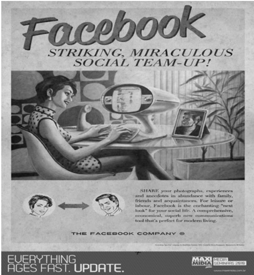
Resim 1: 2010 Pazarlama Kampanyası'ndan Vintage Internet. Maximidia Vintage Ads.

rinin, bir kenara atılmış teknoloji modellerinin aktif bir şekilde dönüştürme pratikleri aracılığıyla farklı bir kullanım için yeniden tasarlanmasıyla ilişkilendirildiği bir sanat metodolojisi haline gelebildiğini ve 'zombi medya'nın da medya arkeolojisinin bir sanat metodolojisi haline gelebilme şekline işaret ettiğini öne sürmektedir.