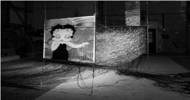
Fotoğraf 1: Gebhard Sengmüller'in A Parallel Image (Paralel Bir Görüntü) adlı enstalasyonu (yerleştirme sanatı)

Parikka, kitabının 'Hayali Medya: Tuhaf Nesnelerin Haritasının Çıkarılması' adlı bu bölümünde, 'hayali medya araştırmaları'na odaklanmaktadır. İmkânsız olanın ve alternatif medya tarihinin yaşayamayan parçalarının